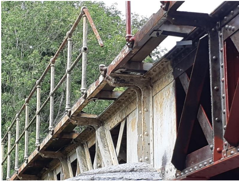
Fig. 6 : Un trottoir et un garde-corps du pont (photo M. Braham, août 2020)

Un contreventement horizontal, fait de cornières disposées en croix de Saint-André, court sur toute la longueur du pont, situé au niveau supérieur des traverses, juste sous les longerons (visibles à la figure 5, ils ne sont pas représentés à la figure 4).