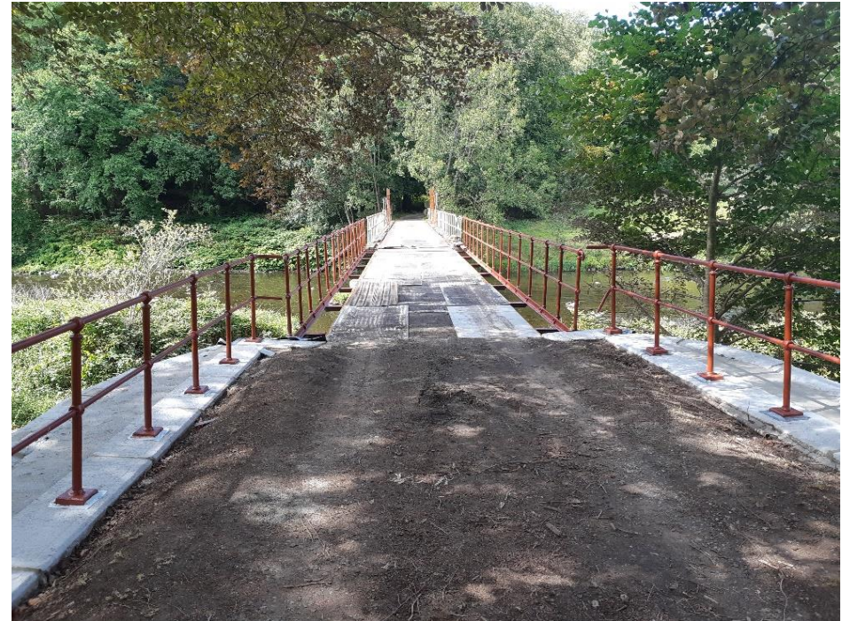
Fig. 7 : L'entrée du pont côté rive droite (photo M. Braham, septembre 2020)

Concernant le système statique de l'ouvrage, s'il est indéniable que la travée en rive droite, la plus courte donc, est indépendante et donc « isostatique », il ne semble pas en aller de même pour les deux travées longues ; tout porte à croire qu'elles forment un ensemble sur trois appuis, hyperstatique donc. Ces particularités se traduisent par des variations irrégulières du nombre de plaques constituant les semelles des membrures des deux maîtresses-poutres.