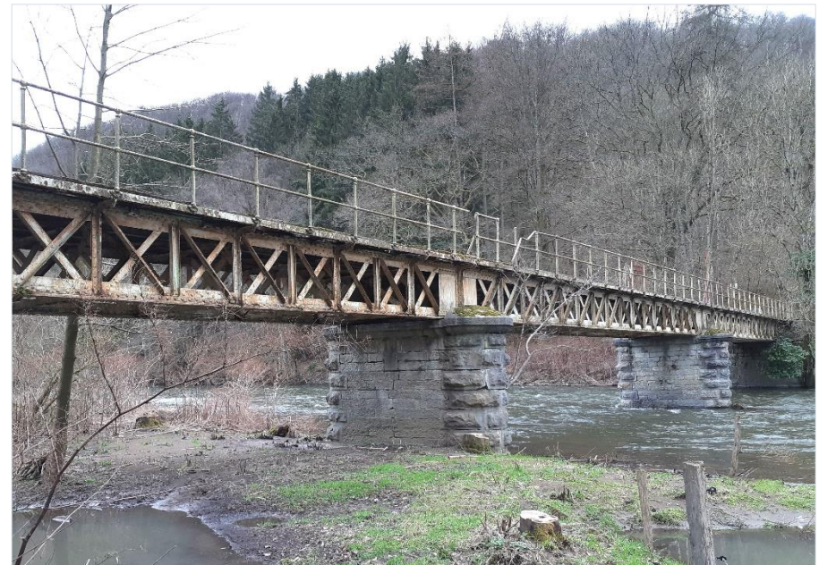
Figure 1 : Vue du pont Orban et du site des Fonds de Quarreux (photo M. Braham, février 2020)

Le pont semble n'avoir eu à souffrir d'aucune des deux guerres mondiales. Il nous est donc parvenu dans son état original. Enfin presque, car manifestement son tablier a dû être remplacé, peut-être même plusieurs fois. C'est certain pour le platelage en bois, et les longerons sont actuellement des profilés en double T laminés à chaud alors qu'à l'origine ils devaient être des profilés obtenus par rivetage de tôles et de cornières, comme l'est d'ailleurs encore aujourd'hui le reste du pont. Une histoire qui pourrait donc passer pour tranquille.