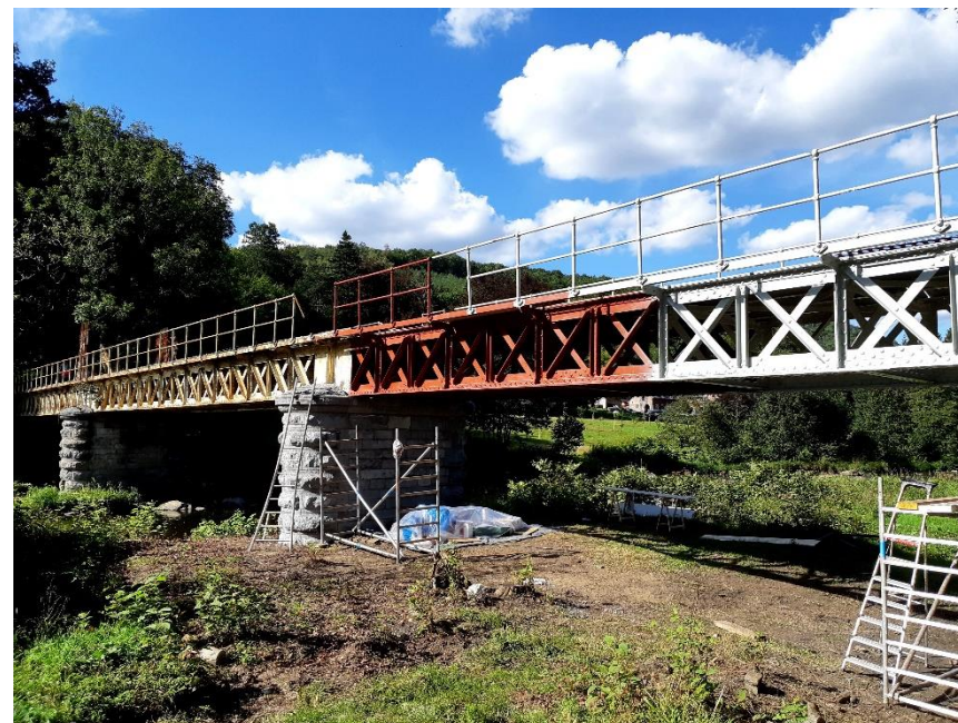
Fig. 9 : La restauration et les travaux de peinture (Photo M. Braham, septembre 2020)