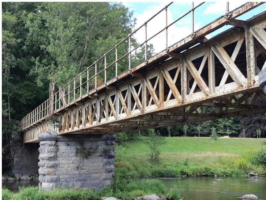
Fig. 8 : le pont original