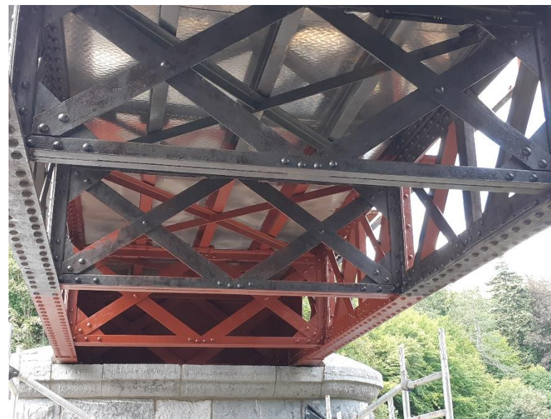
Fig. 5 : Vue du dessous du pont montrant tous les éléments constructifs, notamment 3 des traverses (photo M. Braham, septembre 2020) ↑

Le tablier est composé de longerons espacés de 625 mm qui, avec les membrures supérieures des maîtresses-poutres, supportent un plancher en bois. Ces longerons sont aujourd'hui des profilés en double T laminés à chaud de dimensions 180 x 80 mm ; c'étaient probablement à l'origine des profilés composés de plats et cornières rivés, tout comme tout le reste de l'ouvrage l'est encore.