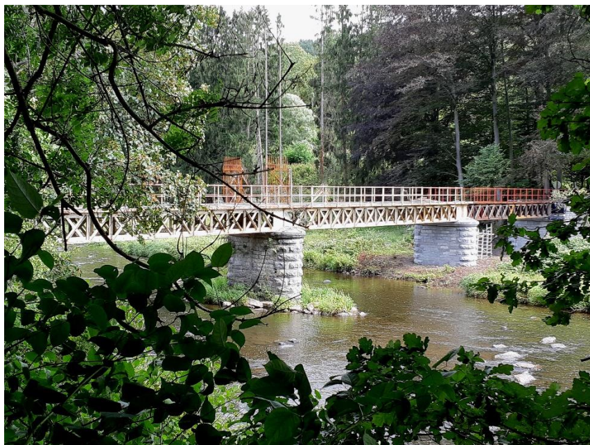
Fig.2 : Vue du pont dans son écrin de verdure